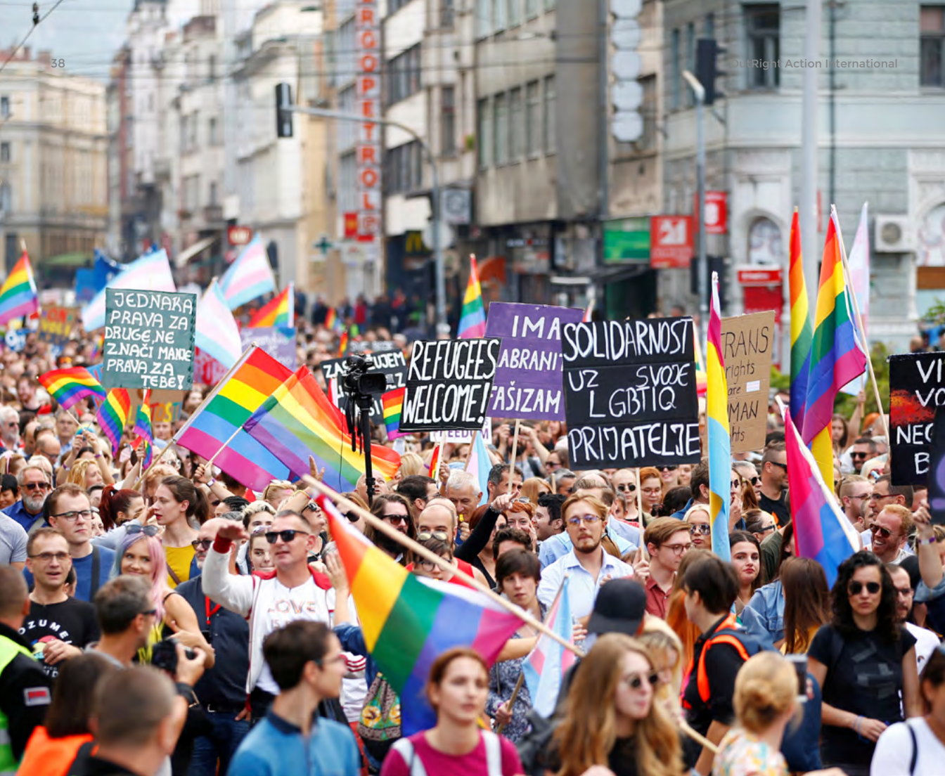
Participantes en la primera marcha del Orgullo en Sarajevo, Bosnia y Herzegovina. Septiembre 8 de 2019.

autoridades “también pueden decidir negar el uso de las calles y otros espacios públicos para una marcha”, dijo Bakić, indicando una serie de obstáculos burocráticos que los organizadores deben superar.