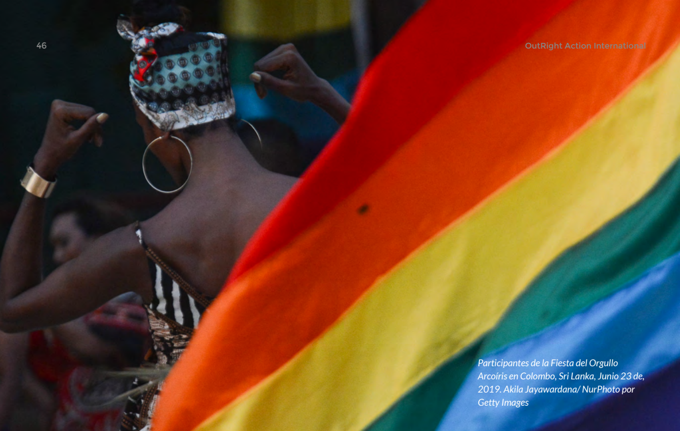
Participantes de la Fiesta del Orgullo Arcoíris en Colombo, Sri Lanka, Junio 23 de, 2019.

Grupos de la sociedad civil han trabajado en una serie de iniciativas, incluyendo sensibilización de los medios de comunicación y programas de inclusión y diversidad con empresas. Las campañas públicas han sido positivas, como afirma Flamer-Caldera: “Realizamos una campaña ‘Aliados por la igualdad’ ( Allies for Equality ) y tuvimos más de 100 videos con personas declarando, en los tres idiomas, ‘Estoy orgullosa de ser aliada’. Tuvimos el video de un hombre mayor Tamil diciendo: ‘Soy un orgulloso aliado de mi hijo gay’ (en lengua Tamil), y ese video se volvió viral. Eso resonó con la gente.” 164