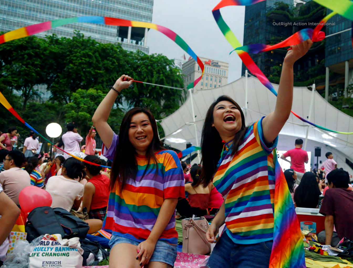
Participantes de Punto Rosa protestan por la revocación de la Sección 377A del Código Penal de Singapur, Junio 29 de 2019.

de cualquier “asociación política”, y declara ilegal los donativos anónimos. 109 De estas formas el Estado busca controlar las protestas, que percibe van “en contra del ‘interés nacional.’” La visibilidad LGBTIQ se interpreta como divisiva, y el gobierno argumenta que solo busca “dejar a los singapurenses conservadores evolucionar en ese tema.” 110