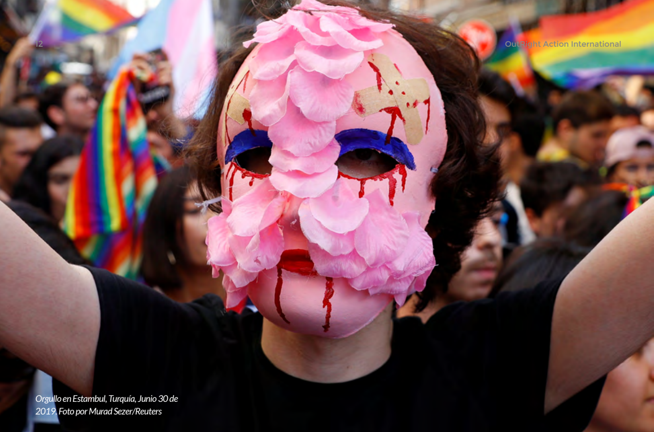
Orgullo en Estambul, Turquía, Junio 30 de 2019.

comunidad agita el odio o incitan a la violencia, creando así una justificación para su persecución.