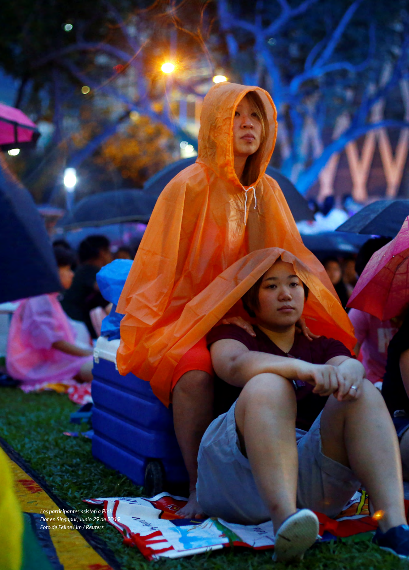
Los participantes asisten a Pink Dot en Singapur, Junio 29 de 2019.