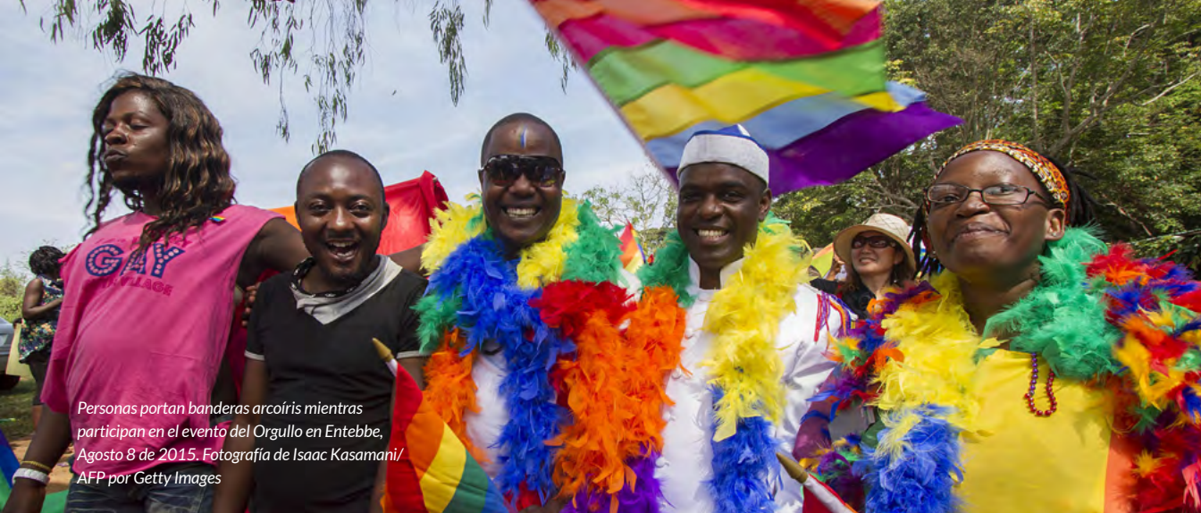
Personas portan banderas arcoíris mientras participan en el evento del Orgullo en Entebbe, Agosto 8 de 2015.

es ilegal, así que todo lo que hacemos, ya sea social o políticamente, se considera ilegal.” 83