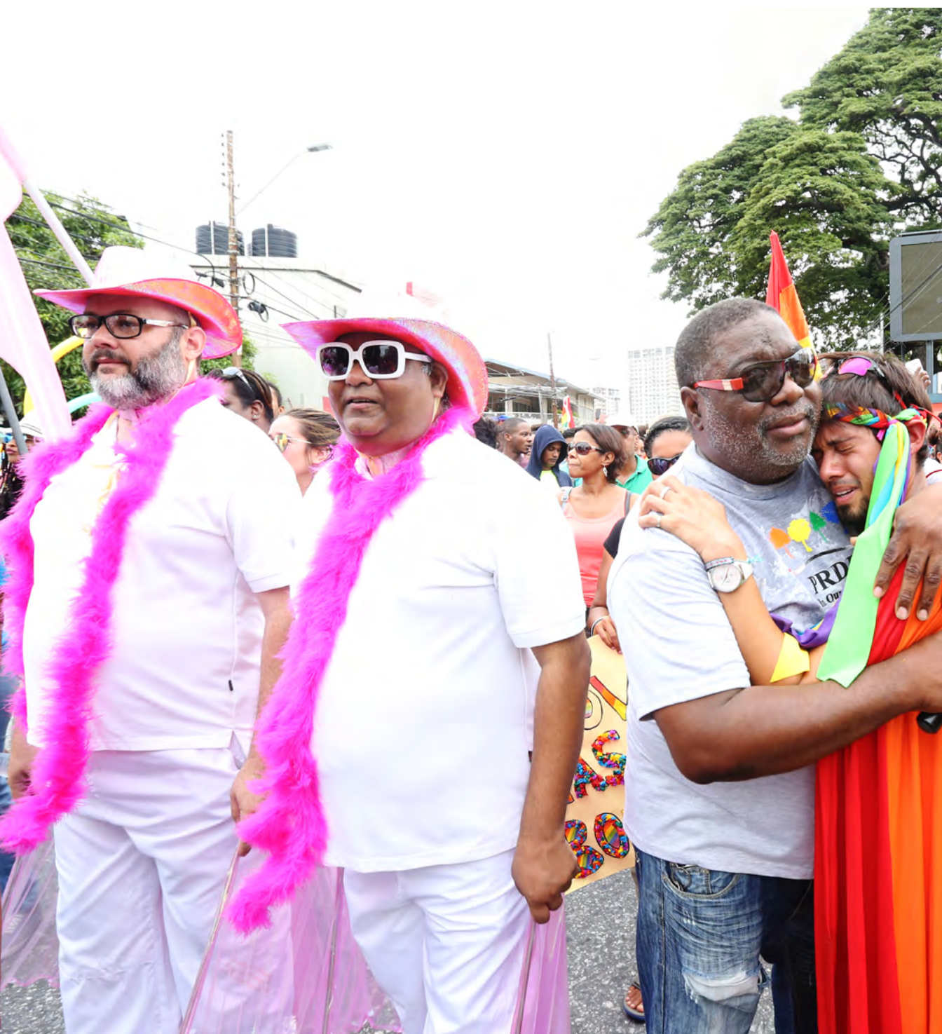
El primer Pride Arts Festival (Festival Artístico del Orgullo) anual se lleva a cabo en 2018 en la ciudad de Puerto España.