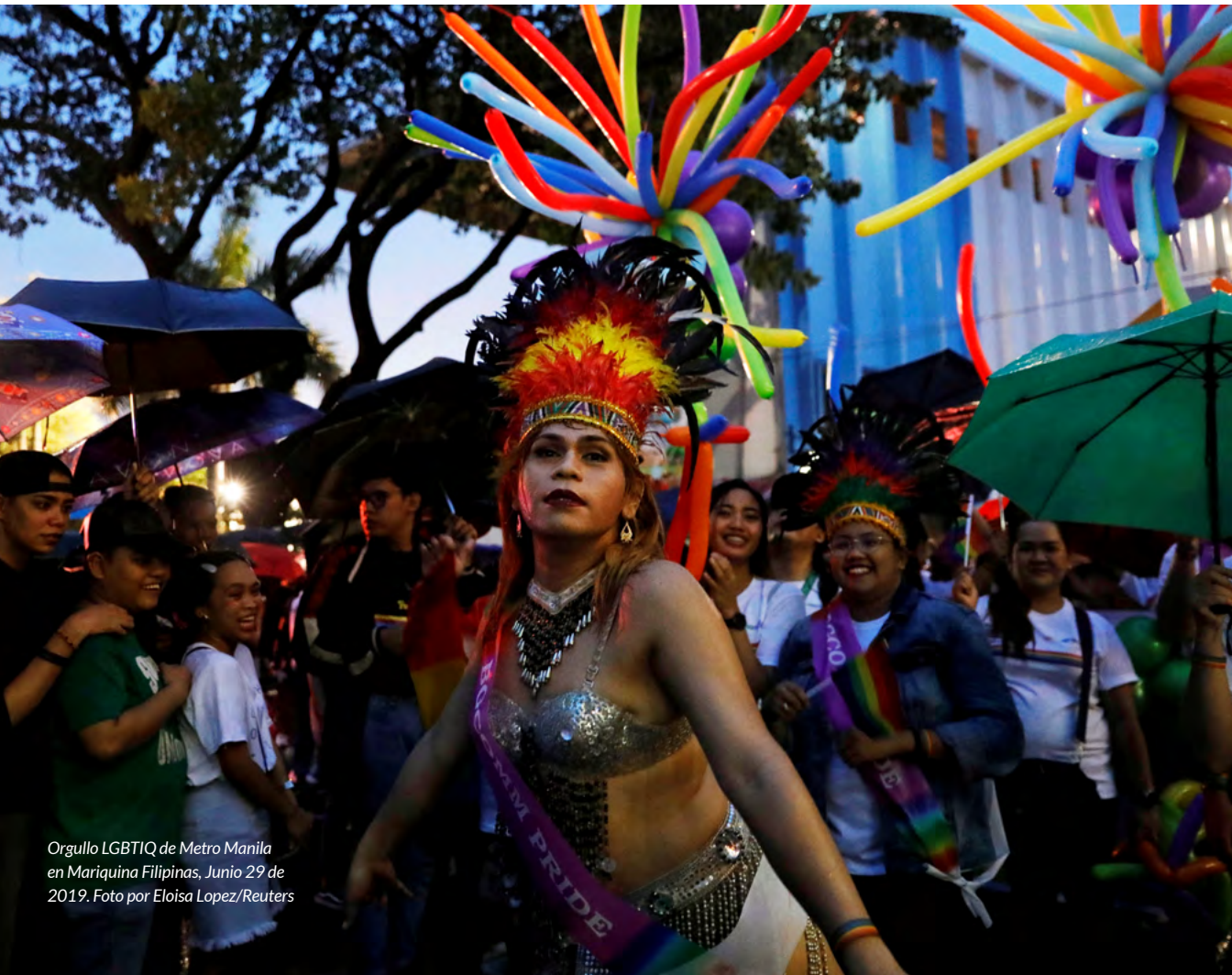
Orgullo LGBTIQ de Metro Manila en Mariquina Filipinas, Junio 29 de 2019.