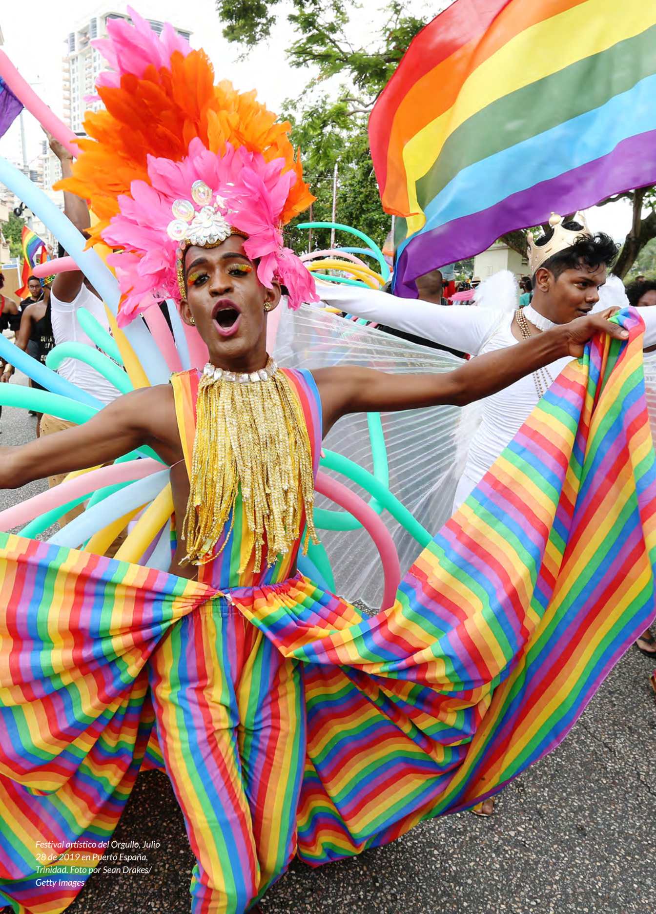
Festival artístico del Orgullo, Julio 28 de 2019 en Puerto España, Trinidad.